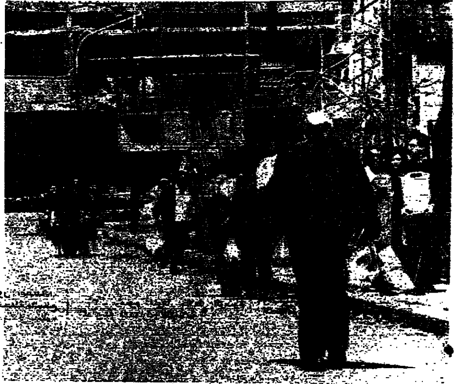
مخيم غابريي الاتحاد - الدورة